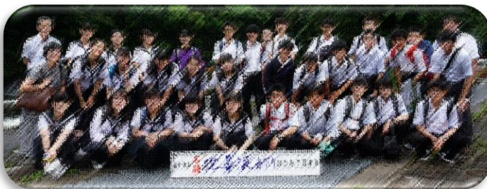
<7月8日 狛鼻溪 学級写真>