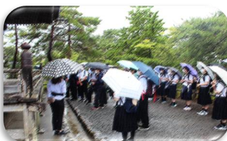
<7月9日 瑞巖寺 見学>