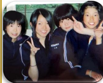
↑ H23 修学旅行で仲の良い友達と撮影(左から2番目)