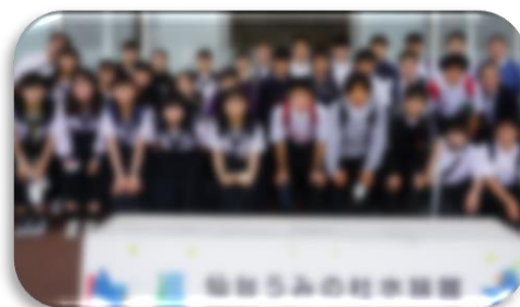
<7月9日 うみの杜水族館学級写真>