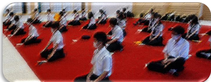
<7月7日 中尊寺 座禅体験>

【1日目:盛岡自主研修、中尊寺 2日目:狛鼻溪、仙台自主研修 3日目:青葉城、松島、うみの杜水族館】