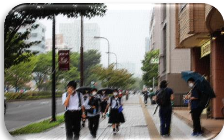
<7月8日 仙台市 自主研修>