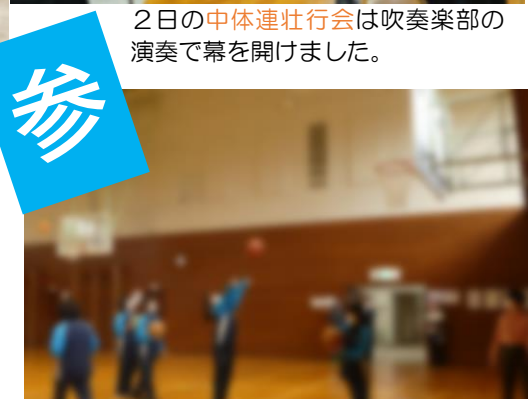
13日は授業公開日でした。たくさんのご来校ありがとうございました。