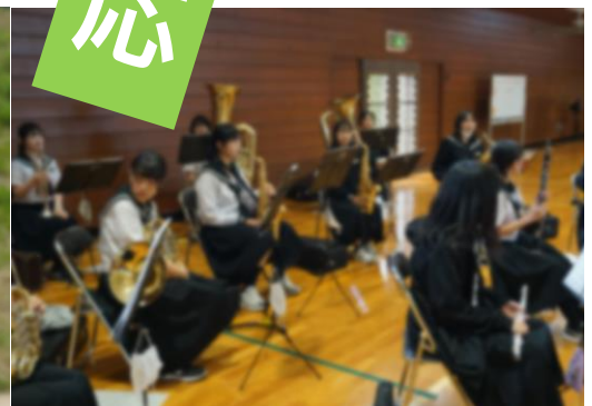
2日の中体連壮行会は吹奏楽部の演奏で幕を開けました。