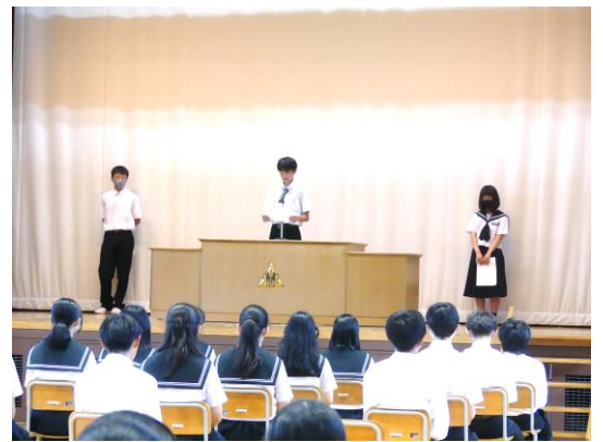
始業式では2学期の抱負が発表されました。

地域の皆様、厚真中学校では8月21日(月)より2学期が始まりました。今後とも本校の教育活動にご理解とご協力のほど、よろしくお願い申し上げます。