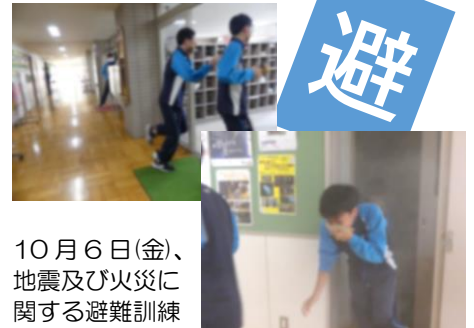
10月6日(金)、地震及び火災に関する避難訓練を行いました。訓練実施後には、多目的室で「煙体験」を行い、火事の怖さを体験しました。日頃からの備えが大切ですね。