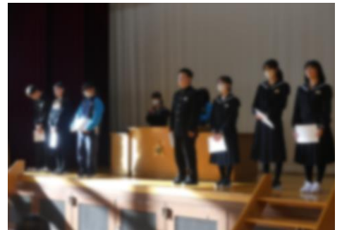
★10月23日(月)に認証式・退任式が行われました。